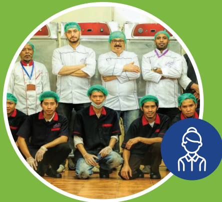
Pelayanan yang Baik