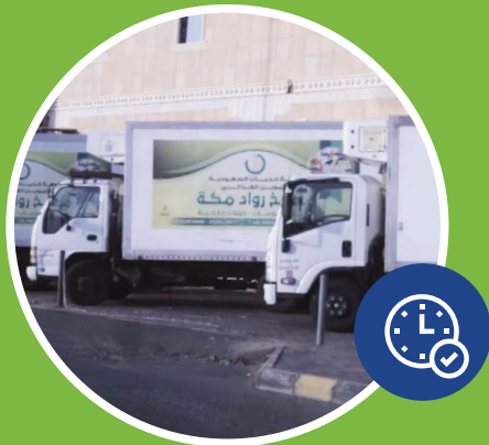
Pengiriman Tepat Waktu